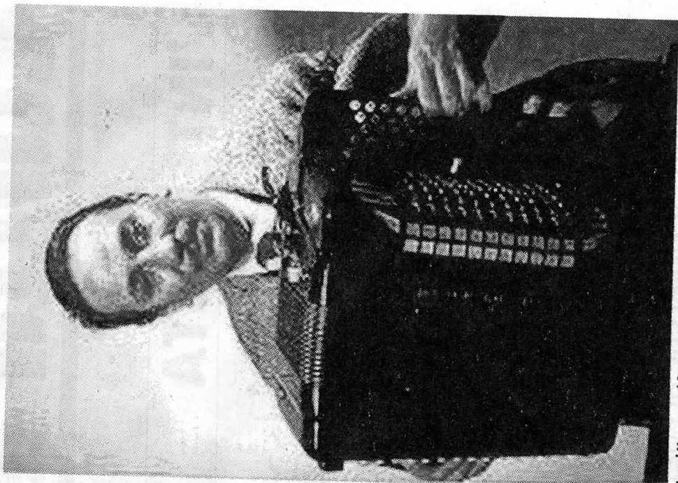
Gorni Kramer: si festeggiano i cent'anni dalla nascita