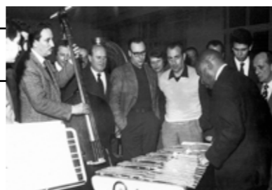
Kramer con Lionel Hampton