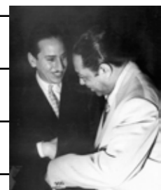
Kramer con Duke Ellington